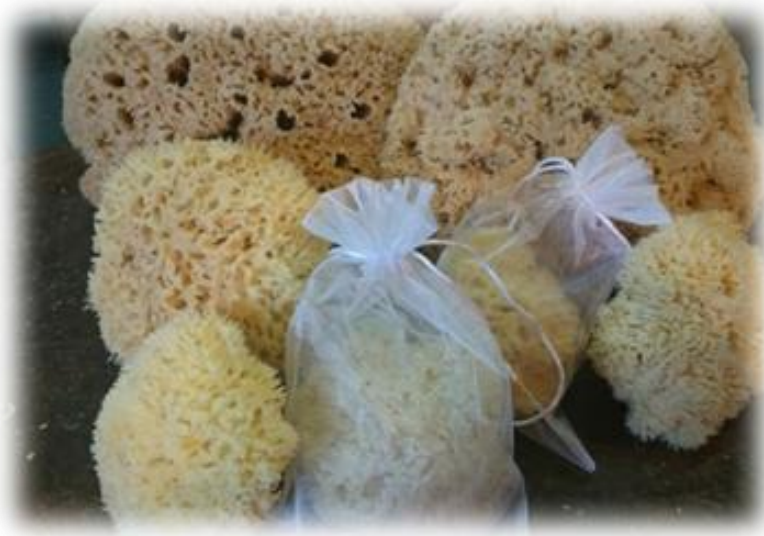
L'éponge dorée de Méditerranée

L'éponge dorée de Méditerranée, Hypospongia Communis , fait partie des 5000 variétés d'éponges naturelles. Elles sont pêchées par des scaphandriers dans les abysses du Sud de la Tunisie. Nettoyées, taillées et blondies par nos soins, elles conservent leur douceur, leur résistance et leur pouvoir absorbant.